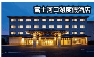
富士河口湖度假酒店