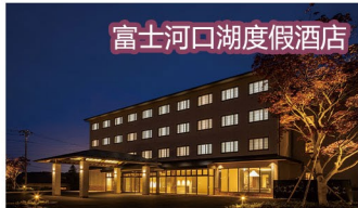
富士河口湖度假酒店