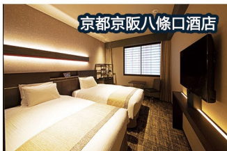
京都京阪八條口酒店