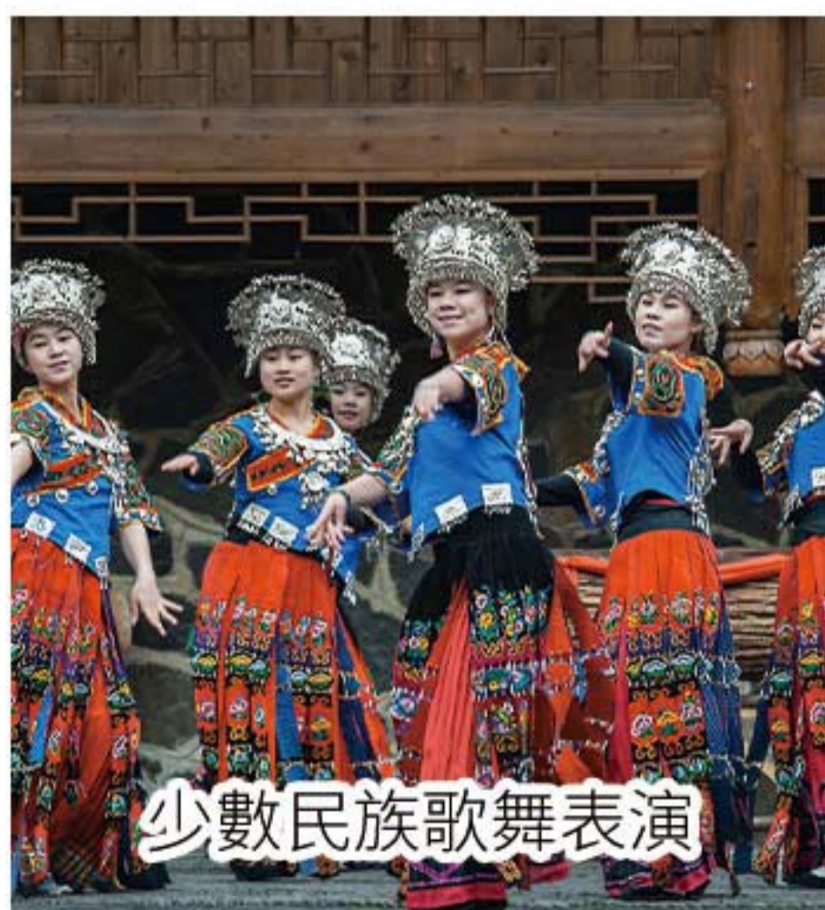
少數民族歌舞表演